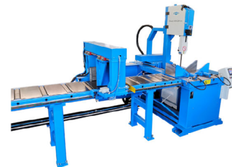
Jaespa Classic 424 DGA