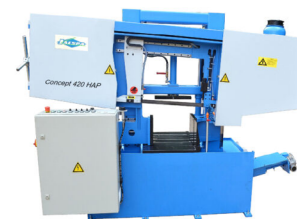
Jaespa Concept 420 HAP