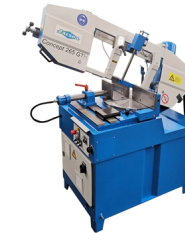
Jaespa Concept 265 GTH