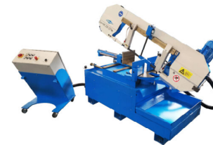
Jaespa Concept 330 GTH