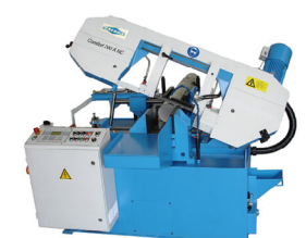
Jaespa Comfort 260 A NC