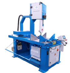
Jaespa Classic 424 DGH