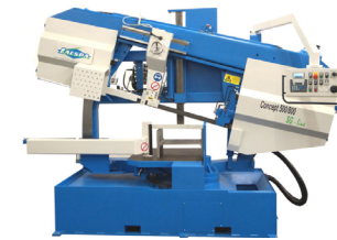
Jaespa 500/800 SG Line