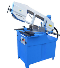
Jaespa Concept 265 GT