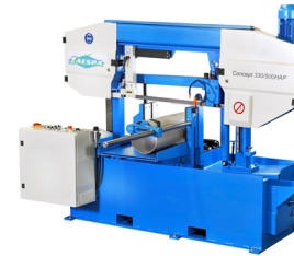
Jaespa 330/500 HAP