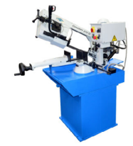
Jaespa Concept 220 G