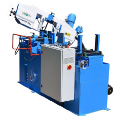
Jaespa Concept 251 GA