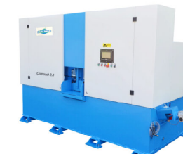
Jaespa Compact 3,8